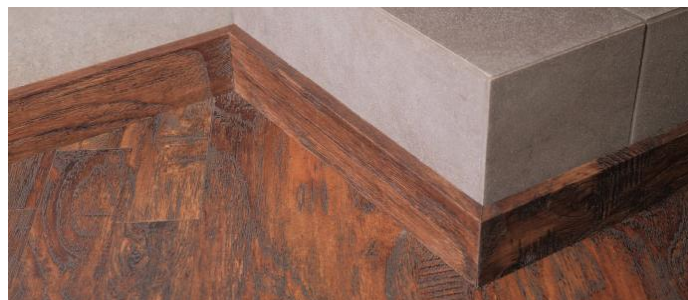
Рис. 4 Результат