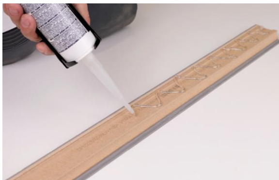
Рис. 1 Нанесение клея на плинтус

Монтаж плинтуса выполняется после укладки чистового напольного покрытия.