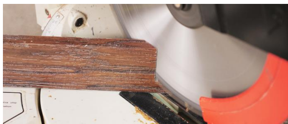
Рис. 2 Подрезка плинтуса

Соединение 2х плинтусов выполняется классическим способом «стык-в-стык».