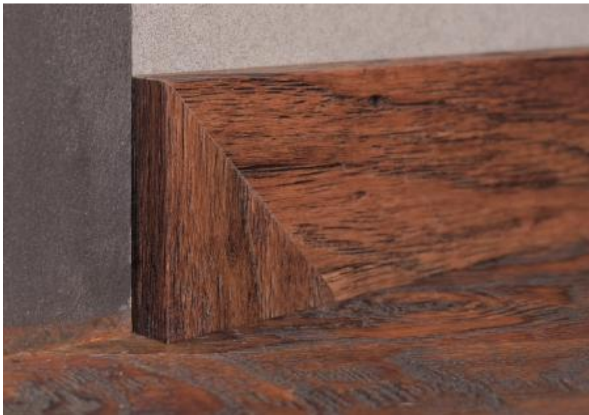
Рис. 5 Оформление торца плинтуса, результат